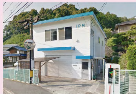
in 広島市安佐北区深川

有限会社アイ・ピー・エムさんは、型づくりの会社です。熟練した技と、NC 機械の高精度加工で、より正確なマスターモデル、開発製品を受注生産しています。簡単な箱型から、複雑なエンジン部品まで、多種多様な形状、素材での対応が可能です。東洋電装は、介護福祉事業の「Dr. 脳タス」の本体の部分などでお世話になっています。