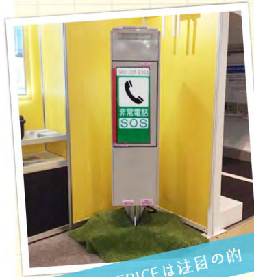
実物のERICEは注目の的