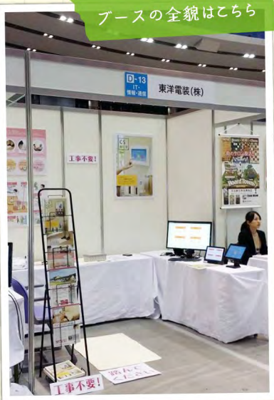
ブースの全貌はこちら