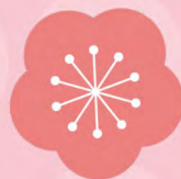
◀p5「東洋電装ぶちニュース」