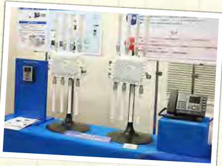
「インターホン (IXシステム)」の通信ネットワークを、「社会インフラ用無線 LAN」でワイヤレス化。

インターホンメーカーのアイホン主催の「ビジネスソリューションフェア」が、日本全国の会場で開催されました。東洋電装はインターホンの通信ネットワークソリューションを紹介いたしました。