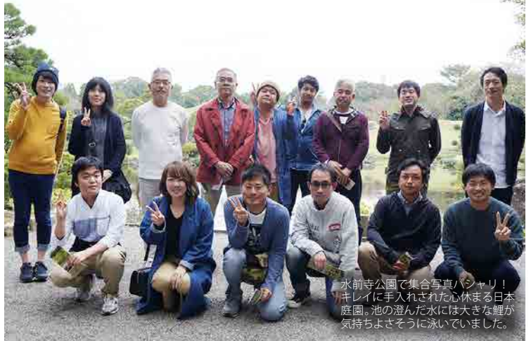
水前寺公園で集合写真パシャリ！キレイに手入れされた心休まる日本庭園。池の澄んだ水には大きな鯉が気持ちよさそうに泳いでいました。

2017年度の社員旅行は、昨年地震の影響でやむなく中止となった熊本旅行にリベンジ。熊本といえば、美味しい料理と壮大な大自然！仕事のこと忘れて、心からリフレッシュできましたか？