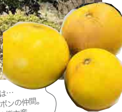
晩白柚（ばんぺいゆ）とは… かんきつ類のひとつでサボンの仲間。 売られているものは97%熊本産。