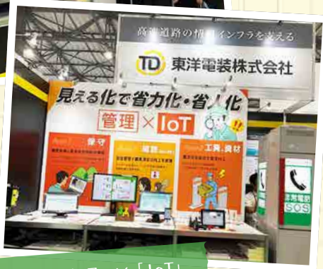
メイン展示は「管理」×「IoT」

高速道路の建設・管理技術「ハイウェイテクノフェア 2019」が、10月8日(火)~9日(水)の2日間にわたり東京ビッグサイトで開催されました。多くのお客様にご来場いただき、誠にありがとうございました。