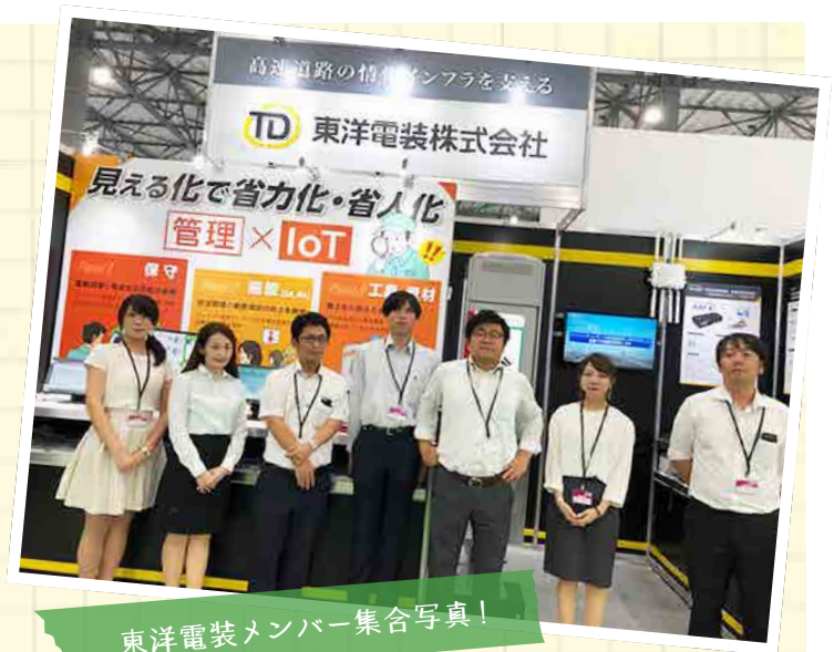
東洋電装メンバー集合写真！