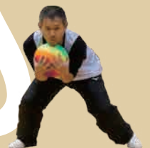
Dodge ball is fun!!!!