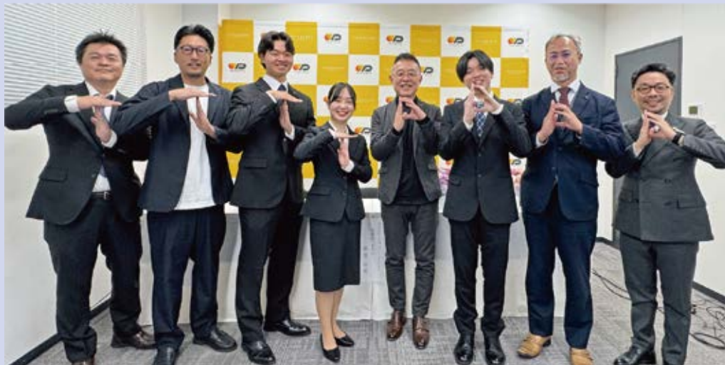
◀ みんな揃ってTDポーズ