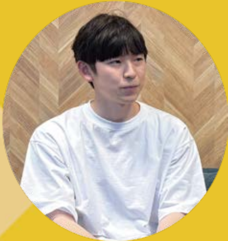
複合技術推進部 データサイエンスチーム