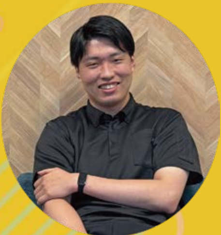
複合技術推進部 データサイエンスチーム