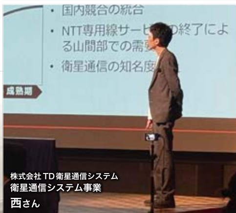
株式会社 TD 衛星通信システム 衛星通信システム事業 西さん