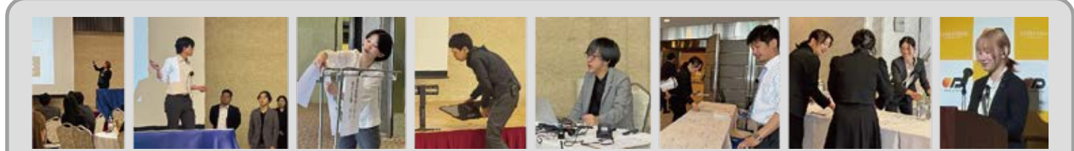
運営メンバーのみなさん、お疲れ様でした!