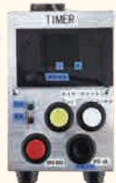
あんま器タイマー