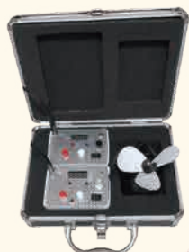
制御盤イメージモデル