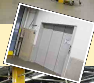
1Fと2Fをつなぐエレベーター！