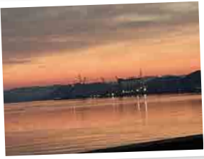
● 大切な人と一緒に散歩しながら見た夕焼け / 江口さん