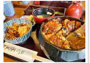
● 旨い写真 / 太田さん