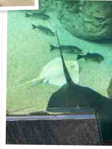
● 友人と行った山口県の実験館で撮影したアルビノのアカエイです。写真だとわかりにくいですが目が赤くなってました。