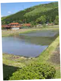
● 田植え作業 / 若宮さん