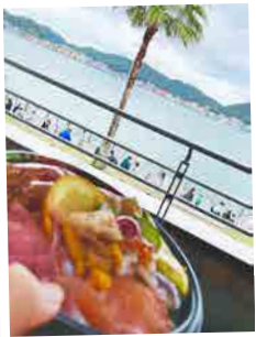
● 大雨の中、唐戸市場まで行ってきました。向こうではなんと雨が止んだので海鮮丼と海で1枚！ / 大野さん