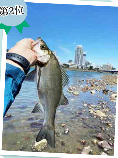
● 旅先で釣ったヒラスズキです / 高田さん