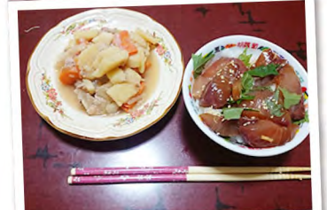
●晩御飯。親父とおいしくいただきました。 / 祖川さん