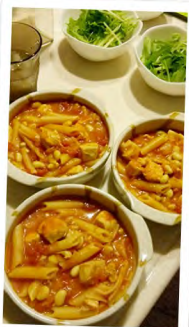
●チキンビーンズです。 大好物です♥ /