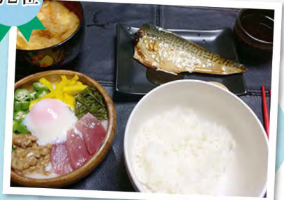
●私が食べたいものを作りました。/ 上さん