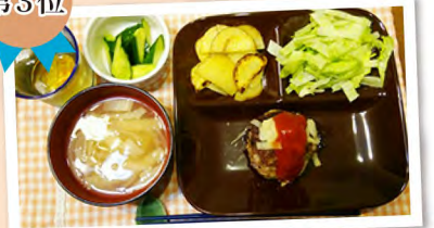
●中川さんにもらったきゅうりを浅漬けに! / 新田さん