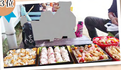
●運動会のお弁当、むすびは旦那作! / 三宅さん