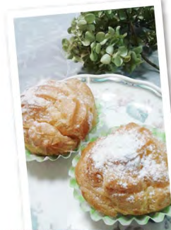
●阿津地さんの誕生日祝いに、 シュークリームを作りました。 / 根石さん